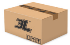
120 pares caja 120 pairs box