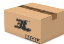
120 pares caja 120 pairs box